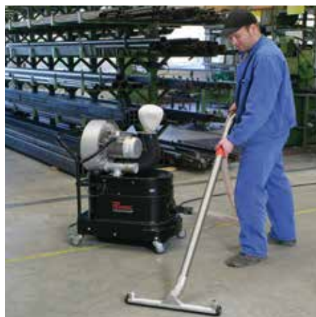
R01 S, clase de polvo M