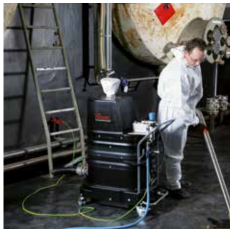
R01 P, clase de polvo M