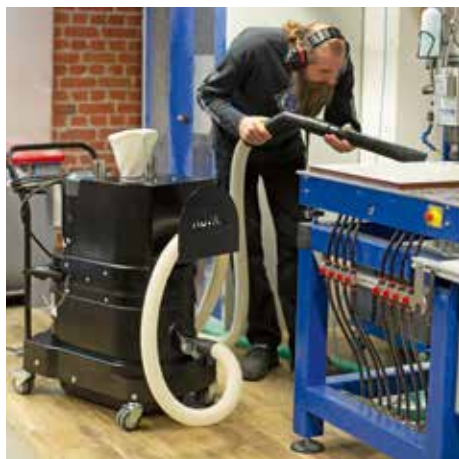
R01 R, clase de polvo L