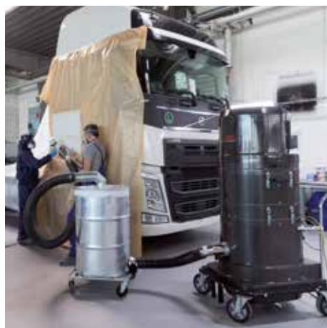
DS 2520, clase de polvo M