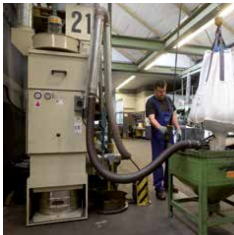
DS 63000 con filtro de bolsa, clase de polvo H