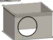
Módulo de afluencia 300 m 2