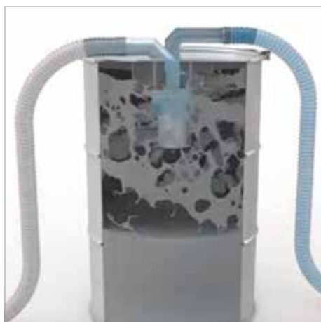
Contenedor de separador previo, 200 litros (corte)