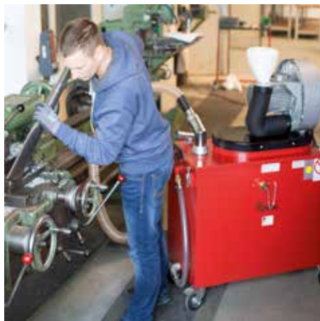
SPS 250-DA 30, clase de polvo M