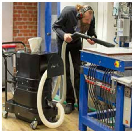
R01 R, clase de polvo M