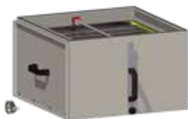
Filtro de polvo residual 36 m 2