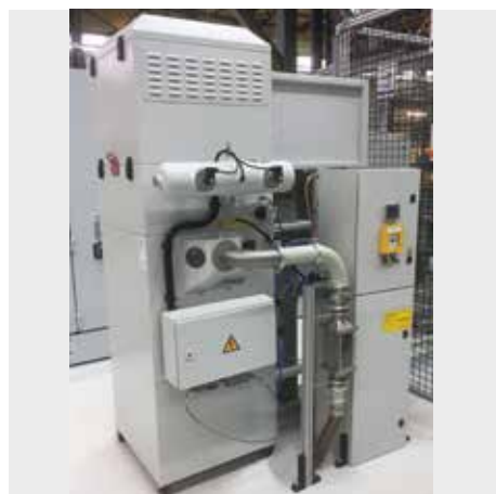
DS 3, clase de polvo M