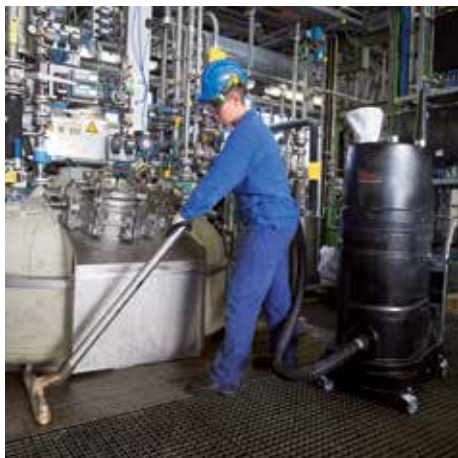
R01 R, clase de polvo H