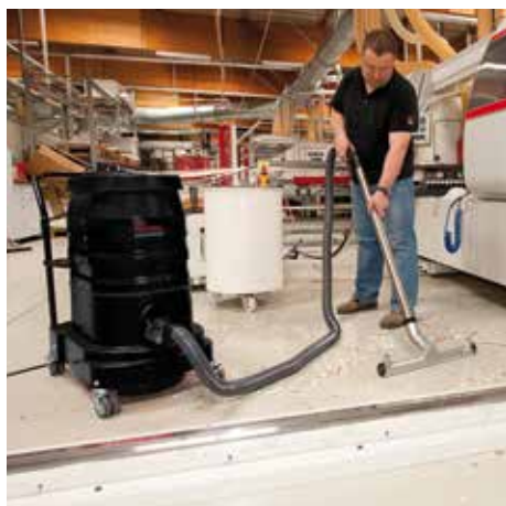
R01 A, clase de polvo L