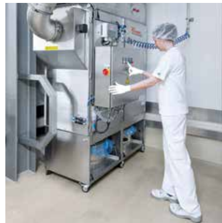
DS 64400 (tándem) con filtro de cartucho, clase de polvo M