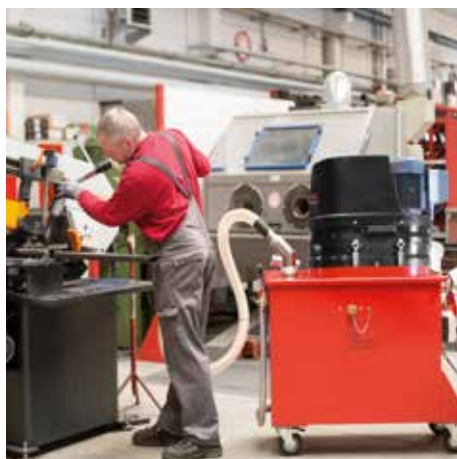
SPS 250, D40 (corriente trifásica)