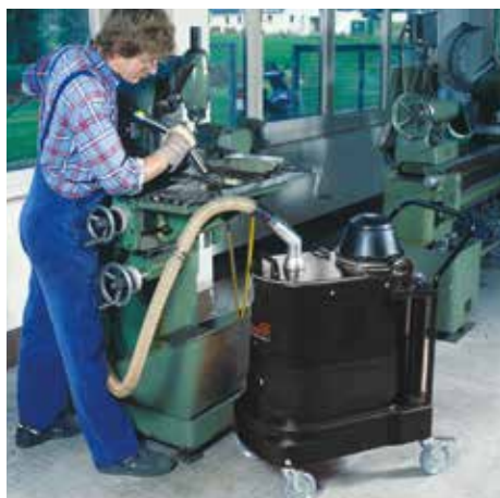
SPS 35, W12 (corriente alterna)