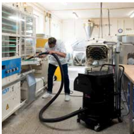
R01 A, clase de polvo L