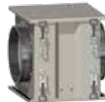
Supresor de chispas