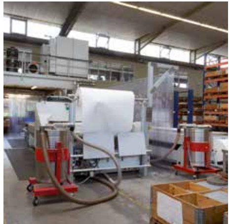
Contenedores de separación previa (200 litros) con dispositivo de vuelco de barril