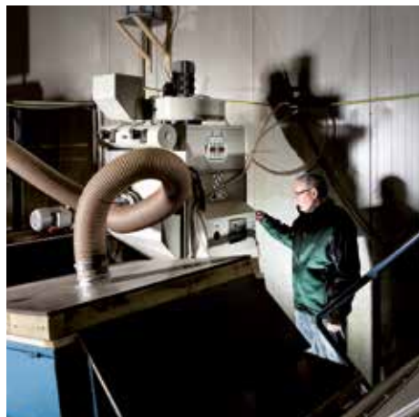
DS 65600 con filtro de cartucho, clase de polvo M