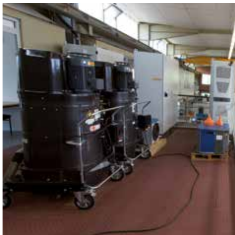
DS 2520, clase de polvo M