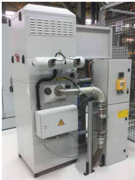
DS 3, clase de polvo M