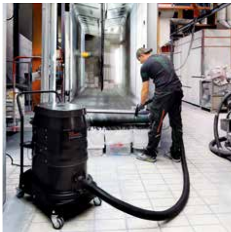
R01 A, clase de polvo M