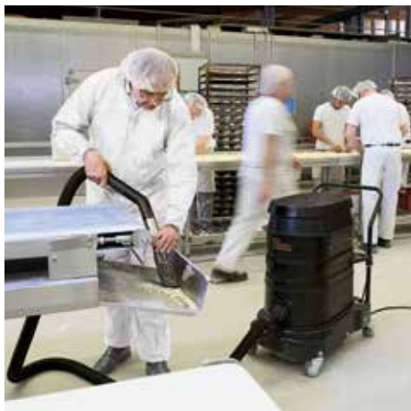
R01 A, clase de polvo M