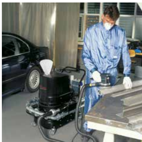
R01 R022 con supresor de chispas, clase de polvo M