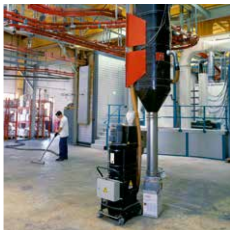
R01 R, con silo, clase de polvo M