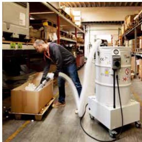
DAV-SB, clase de polvo M