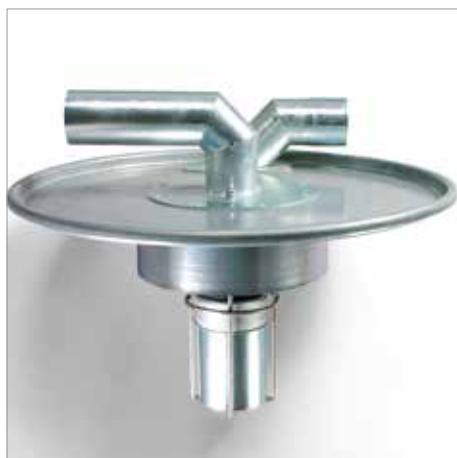
Tapa de separador previo con interruptor de flotador y esterilla separadora por gotas