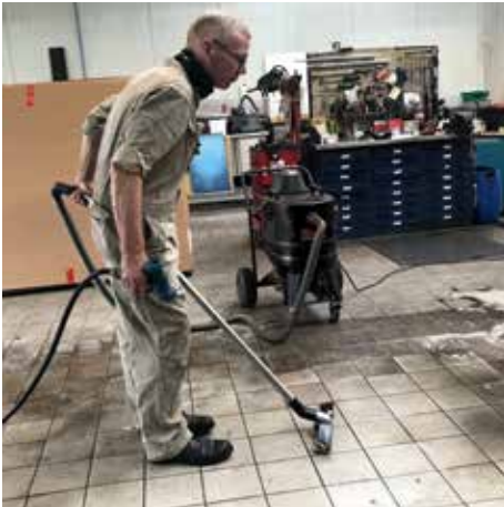
WSP 2000, 45 litros volumen de relleno