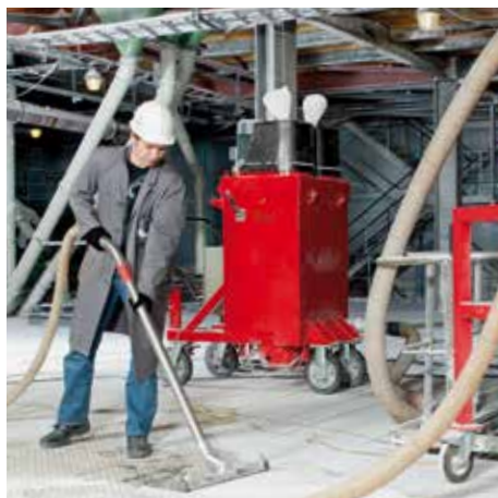
DS 4150, clase de polvo L