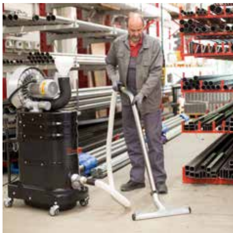
R01 S, clase de polvo H