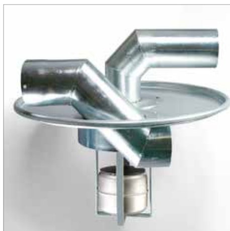
Tapa de separador previo con interruptor de flotador