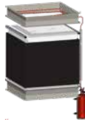
Apagafuegos para categoría de inflamación A, B, C o D