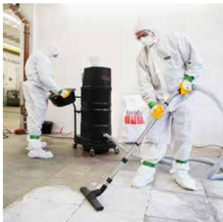
DS 2520, clase de polvo H