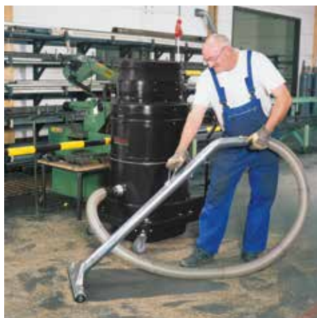
WS 3320, clase de polvo M