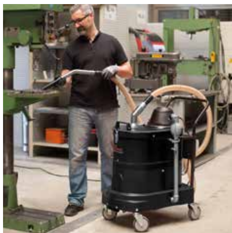
SPS 35, W12 (corriente alterna)