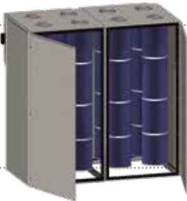
Filtro de cartucho 48 m 2