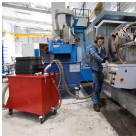
SPS 250, W24 (corriente alterna)