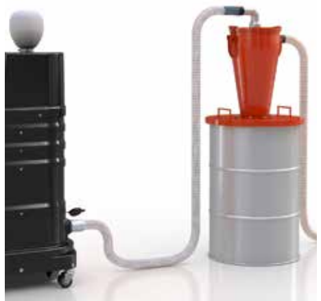
Ciclón en separador previo con R01 R