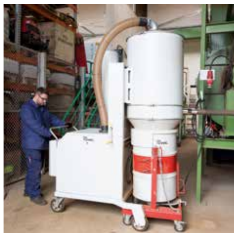
DA 5150, clase de polvo M, con dispositivo de vuelco de barril