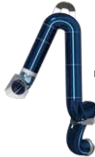
Brazo de aspiración