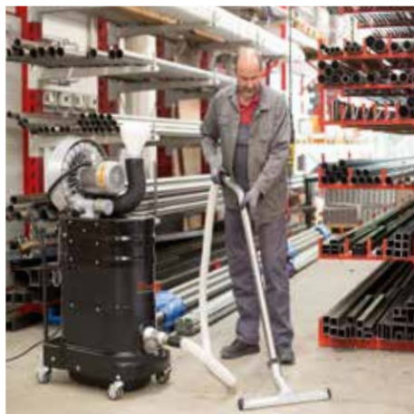
R01 S, clase de polvo L