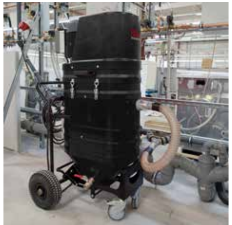
WSP 2000, 100 litros volumen de relleno