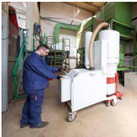
DA 5150, clase de polvo M