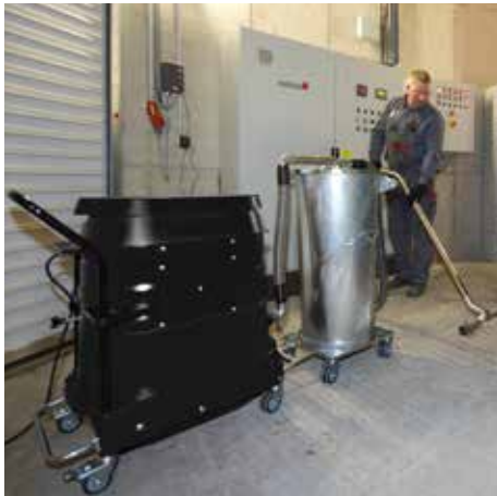
R01 A con contenedor de separador previo, 110 litros