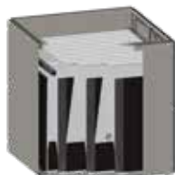
Filtro de bolsa 3 m 2 – 10 m 2