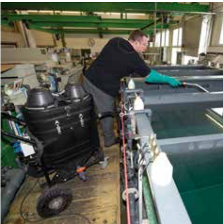
WSP 2000, 85 litros volumen de relleno