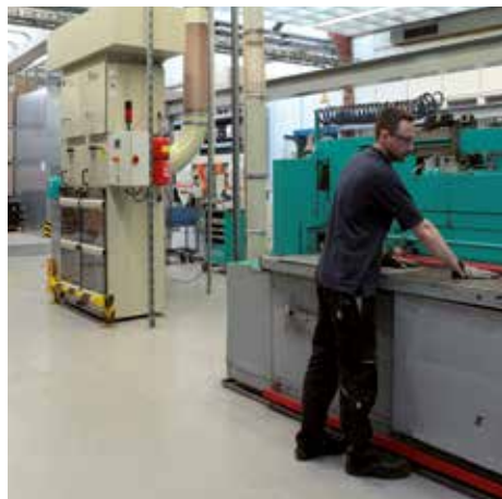
DS 64400 (tándem) con filtro de bolsa, clase de polvo H