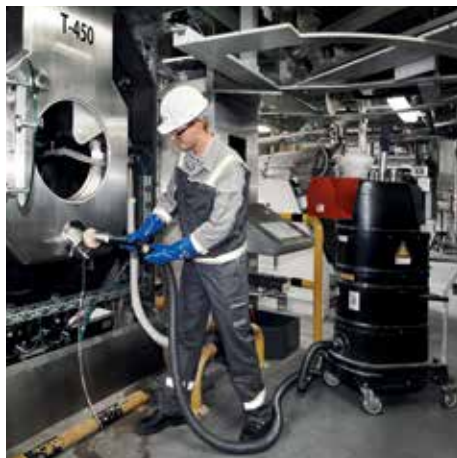
R01 R, clase de polvo M