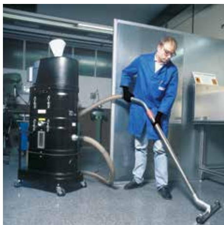
NA 35 - D1

Separador húmedo / accionamiento monofásico Aspiración de materiales reactivos