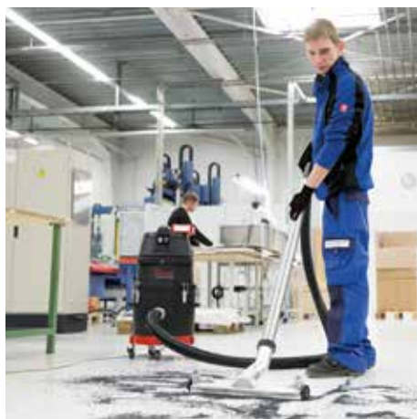
WS 200, clase de polvo H