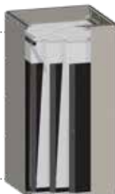
Filtro de bolsa 20 m 2