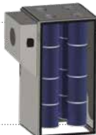
Filtro de cartucho 24 m 2