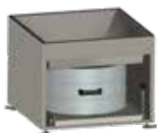
Bandeja de polvo V2A, 55 litros