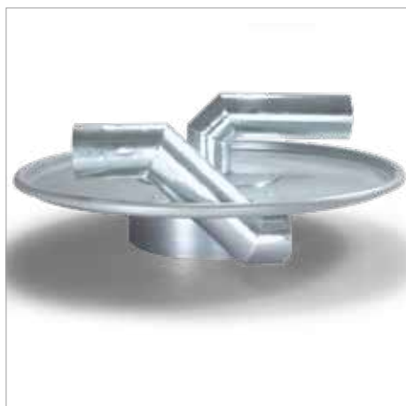
Tapa de separador previo con esterilla separadora por gotas